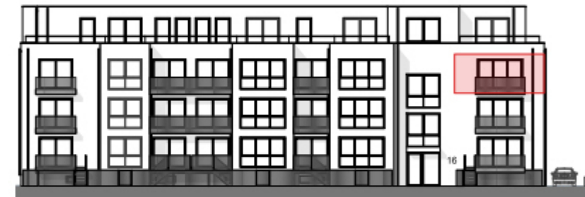
Ansicht West - Straßenseite "Am Bramhoff" -