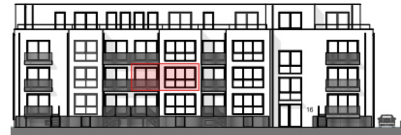
Ansicht West - Straßenseite "Am Bramhoff" -