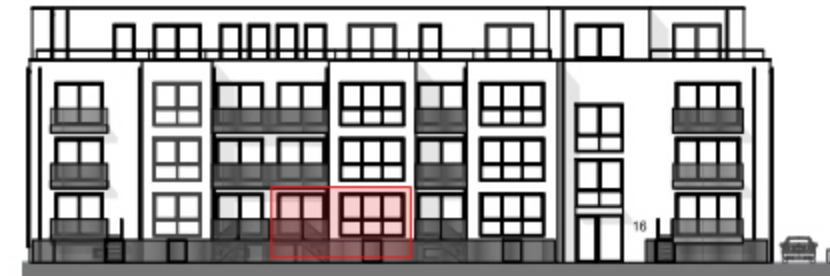
Ansicht West - Straßenseite "Am Bramhoff" -