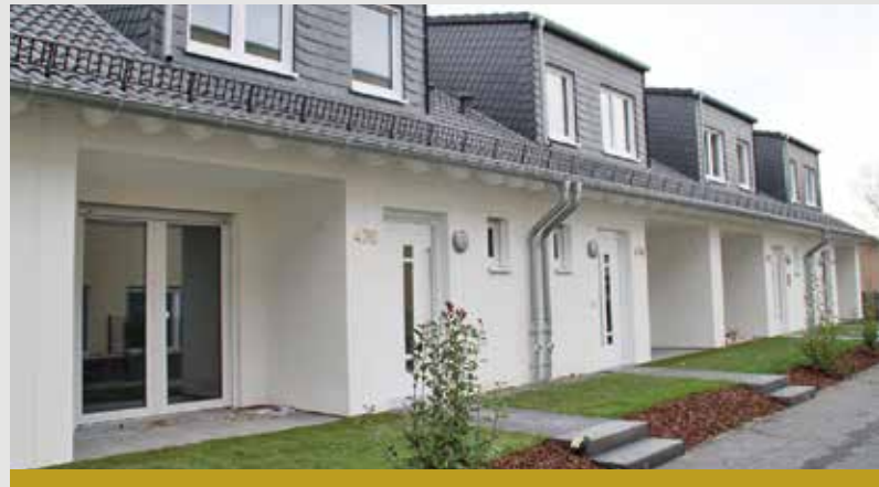
Neubau Mehrfamilienhaus in Bonn-Mehlem